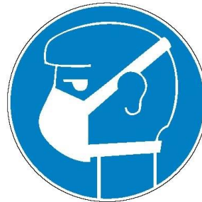
Stofmasker P3, indien voorzorgsmaatregelen niet kunnen gegarandeerd