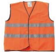
Signalisatiekledij verplicht te dragen