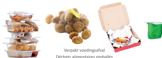
Verpakt voedingsafval Déchets alimentaires emballés Packaged food waste