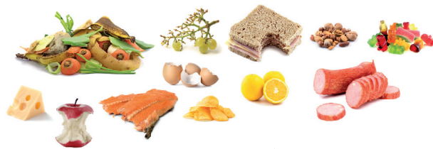
Alle rauwe en gekookte voedingsafval en -resten Tous les déchets et restes alimentaires crus ou cuits All raw and cooked food waste and food scraps