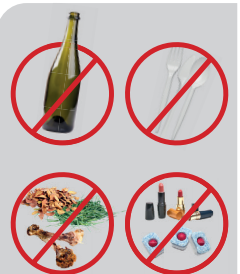
Tuinafval, gemaaid gras, bladeren, twigen, zaagsel, houtkrullen, schelpen, botten, glas, cosmetica, reinigingsmiddel, plastics